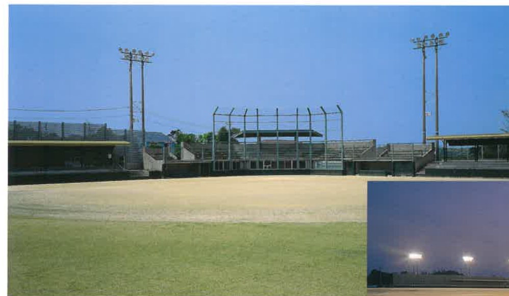
グラウンド(野球場)