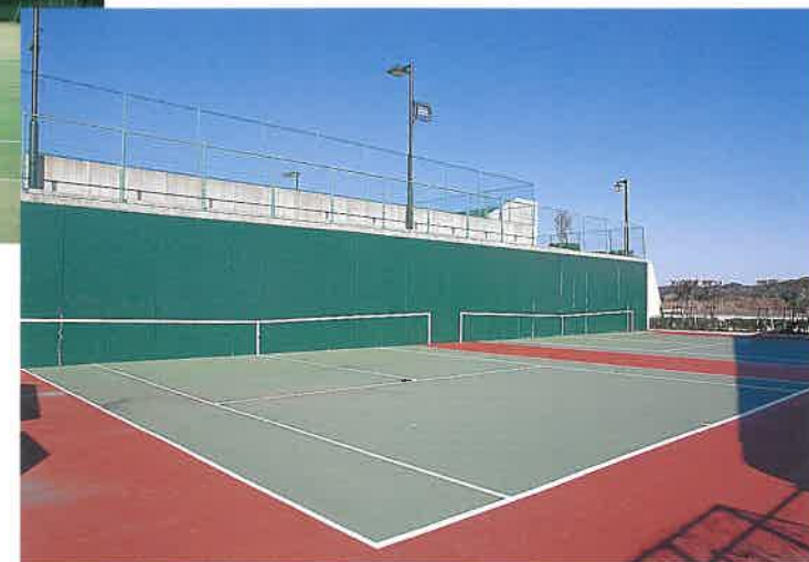
テニスコート(壁打ちコート2面)