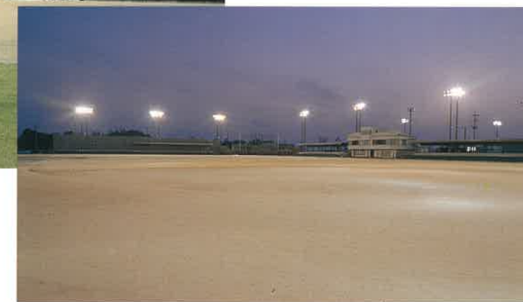
グラウンド全景(ナイター)