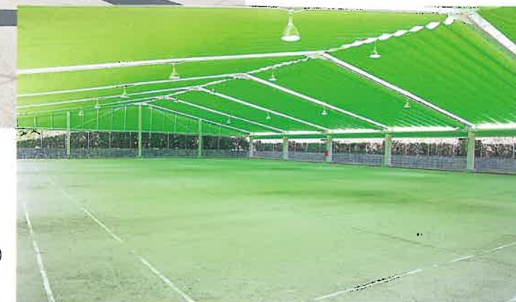
ゲートボール場(クロス)