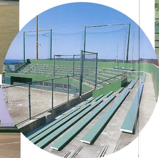
ソフトボール場(ホーム観覧席)