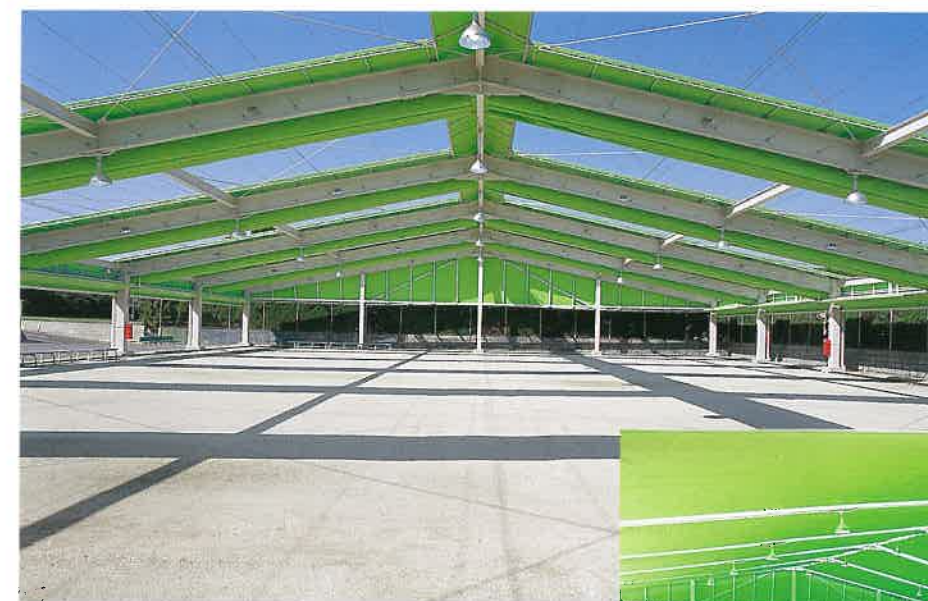
ゲートボール場(オープン)