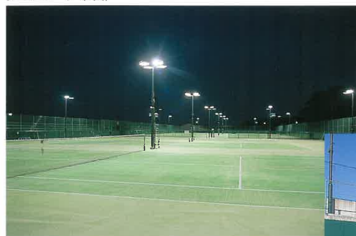
テニスコート(ナイター)