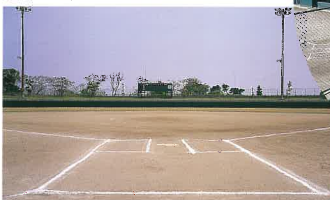
ソフトボール場(ホームより)