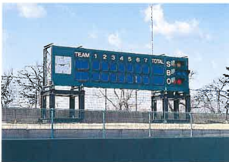
ソフトボール場(掲示板)