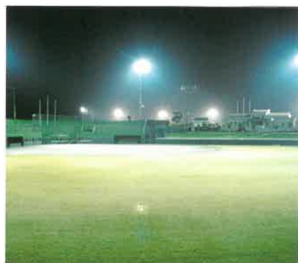
ソフトボール場(ナイター)