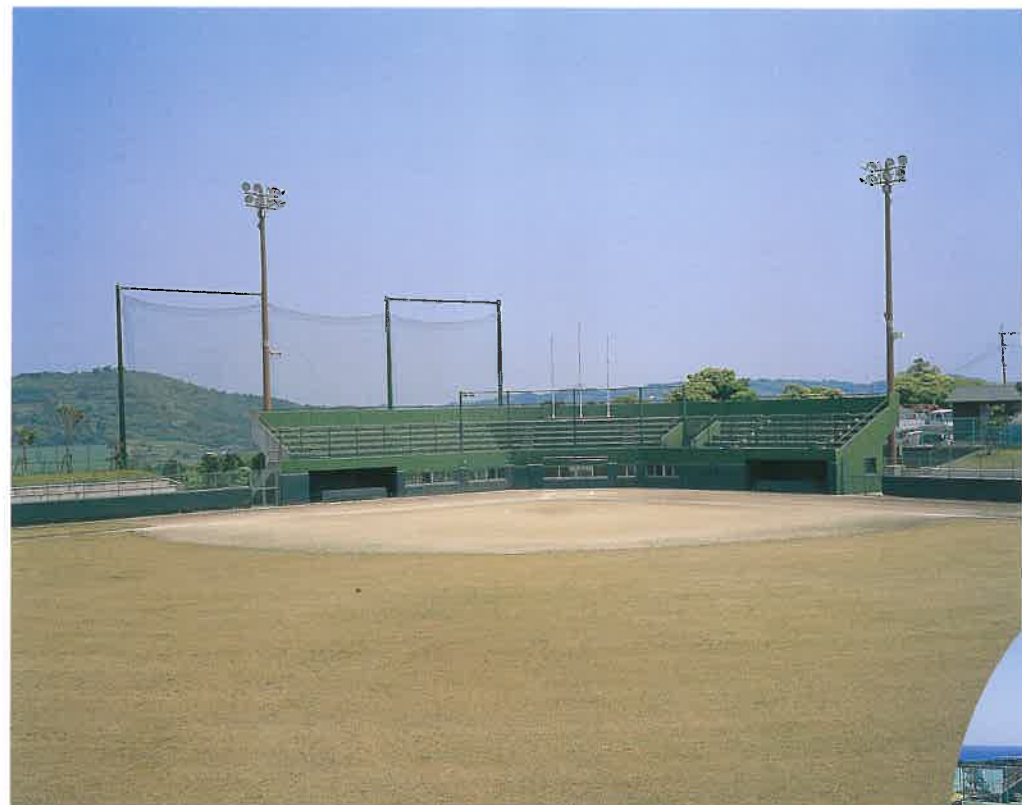
ソフトボール場(外野席より)