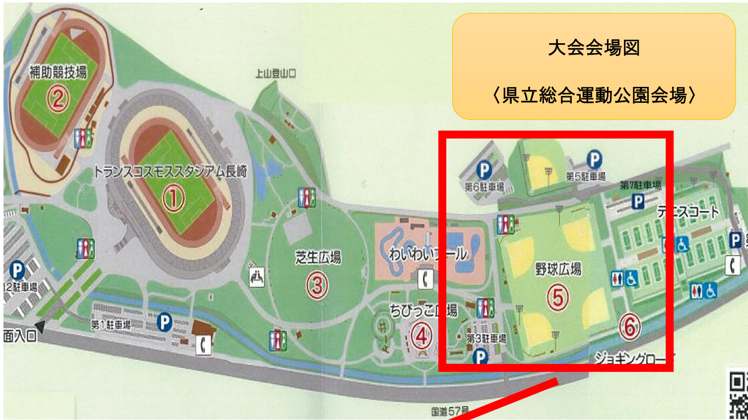
大会会場図 〈県立総合運動公園会場〉